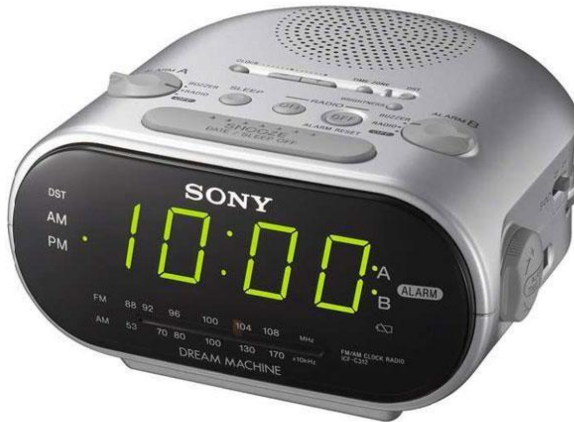
Abb. I, siehe Quellenverzeichnis